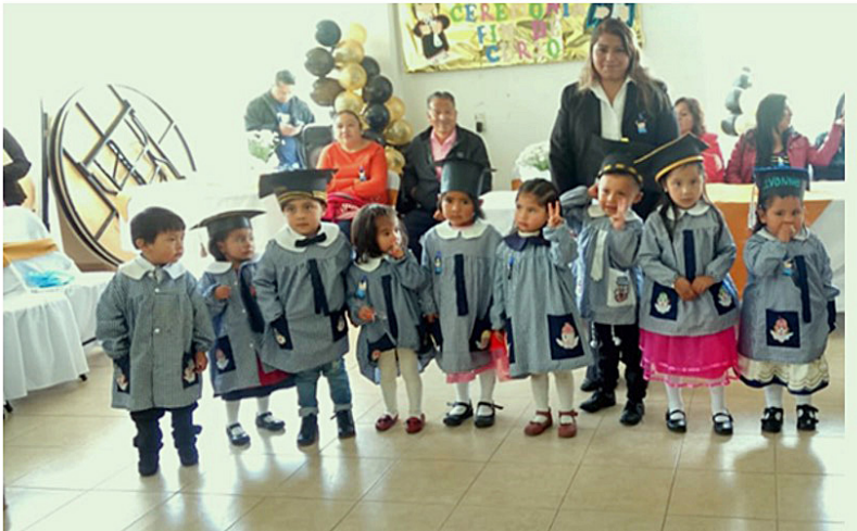
Imagen 2. Graduación en el Jardín de niños. Autor: Ezly Lara.

Dentro de esos servicios se encuentra el preescolar de la comunidad de Zacamulpa Tlalmimilolpan donde durante el ciclo 2019-2020 asistían un total de 12 niños originarios de la comunidad, de diferentes años de preescolar, algunos de ellos en ese momento estaban por concluir el preescolar.